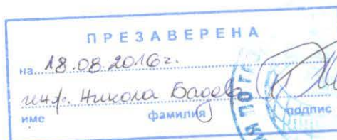
Схема № 34858 / 26.11.2012 г. е издадена въз основа на документ с входящ № 09-30766 / 22.11.2012 г.