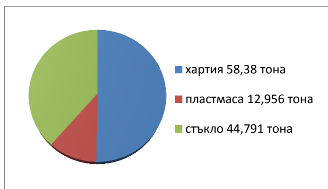
графика 2 Количество събрани рециклируеми отпадъци от опаковки през 2017 г.

От жълтите контейнери – 128,681 тона, от зелените контейнери – 44,38 тона, а след сепариране са отделени 116,127 тона рециклируеми отпадъци от опаковки по видове, посочени на графика 2